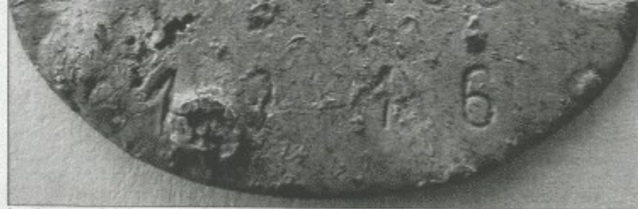
La plaque avait été retrouvée dans un jardin de Bras-sur-Meuse, au nord de Verdun.

rites » historique oubliées dans nos tiroirs, le destin de cette plaque a été ravivé par l'approche du centenaire. « À l'approche de la date anniversaire de la guerre de 1914, cette trouvaille m'est revenue en tête », raconte le Lorrain. Sa première idée est d'en faire